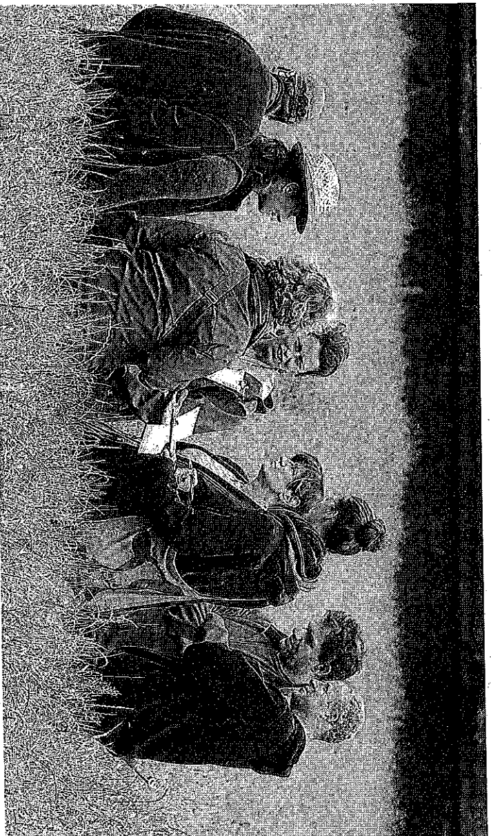
Les membres du jury se concertent et échangent leurs avis sur la prairie qui leur est présentée à Daoulas.